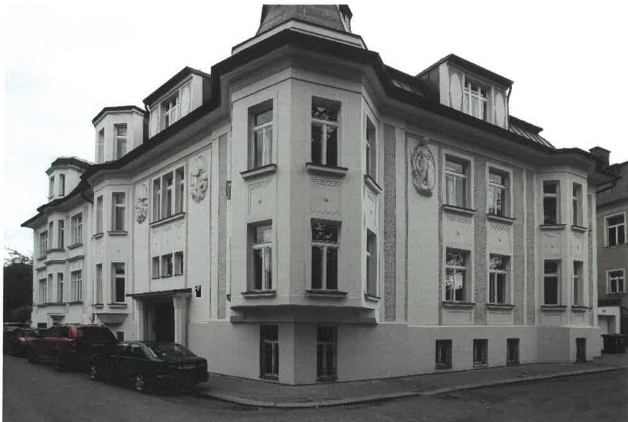
Fotodokumentace - Na Baště sv. Jiří 258/7, část prostor v suterénu objektu